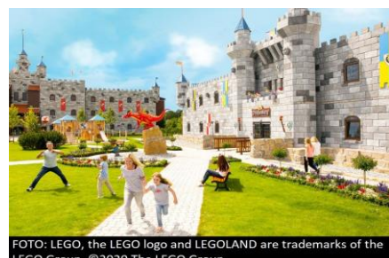
FOTO: LEGO, the LEGO logo and LEGOLAND are trademarks of the LEGO Group. ©2020 The LEGO Group.